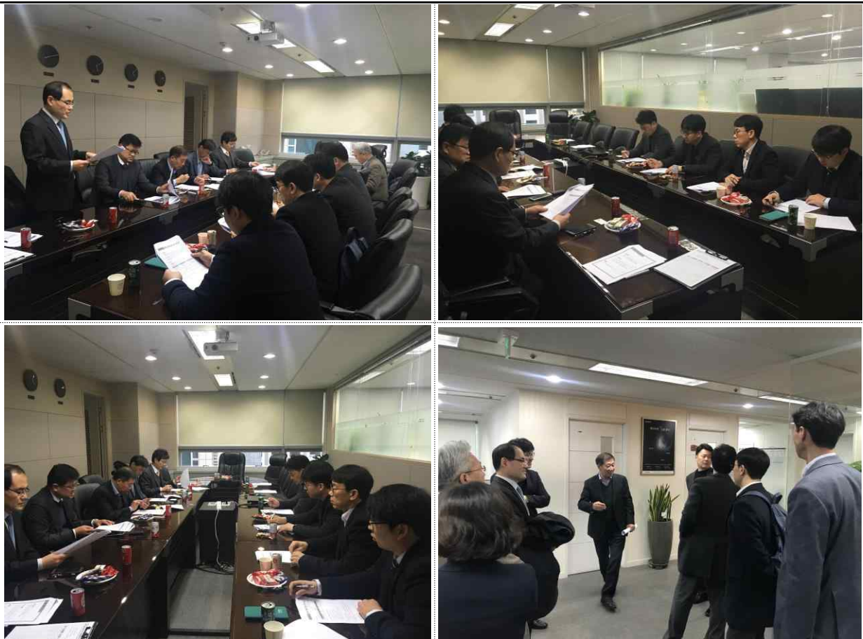
<한국데이터산업협회 데이터솔루션(28차)/해외협력(7차) 분과 정기회의>